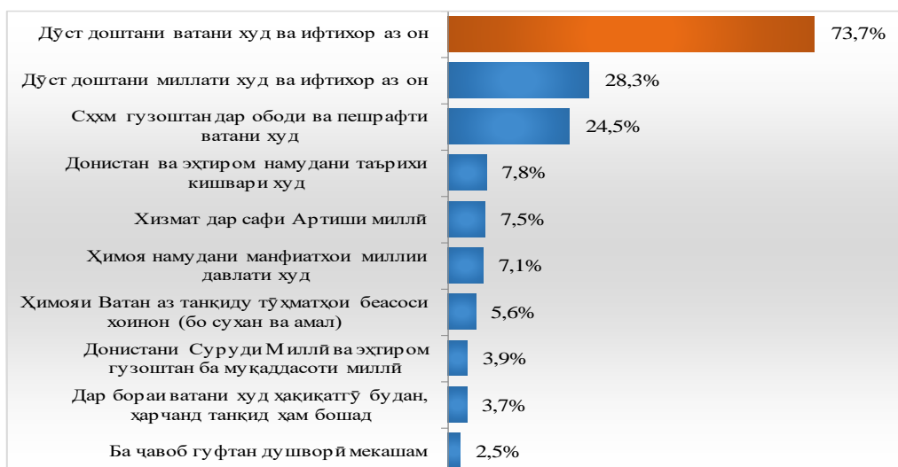
Диаграммаи 2. Ба назари Шумо ватандӯстӣ чист? (n=5150, %)

Ватандӯстии ҷавонон, пеш аз ҳама, дар ҳимояи манфиатҳои миллӣ ва ҳифзи Ватан бо суҳан ва амал ифода меёбад. Аксарияти мусоҳибони ҷавон қайд кардаанд, ки ҳангоми дар сомонаҳои интернетӣ ва шабакаҳои иҷтимоӣ пайдо шудани видеоролиқҳо ва ё навиштаҳои зидди Тоҷикистон шарҳи худро навишта, аз кишвар ҳимоя мекунанд. Ин посухҳои мусоҳибон аз он шаҳодат медиҳад, ки ҳисси ватандӯстии аксарияти донишҷӯён баланд аст ва дар тарбияи ватандӯстии ҷавонони донишҷӯ омӯзгорони Донишгоҳи миллии Тоҷикистон саҳми калон доранд.