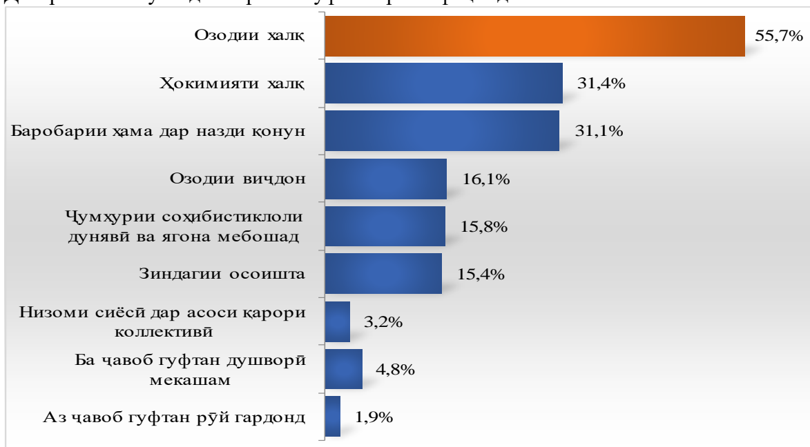
Диаграммаи Шумо демократия гуфта чиро мефаҳмед?

4) Дар баробари сатҳи нокифояи маърифати динӣ ва хотираи таърихӣ, инчунин назарпурсӣ нишон дод, ки сатҳи дониши сиёсии мусоҳибон низ паст аст. Ба мазмуни мафҳумҳо сарфаҳм рафта наметавонанд, онҳоро аз ҳамдигар фарқ намеkunанд. Масалан, барои таҳқиқ кардани сатҳи донишҳои сиёсии мусоҳибони саволи “Шумо демократия гуфта чиро мефаҳмед?” гузошта шуд. Фоизи ҷавобҳои мусоҳибонро вобаста ба ҷавобҳои зикршуда дар диаграммаи зер нишон медиҳем: