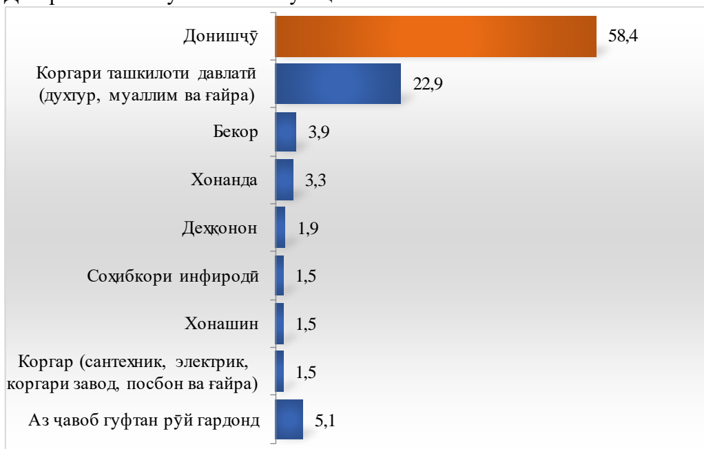
Диаграммаи касбу тахассуси мусохибон

5) касб ва тахассус - 19 нафар, 1,5% коргар (сантехник, электрик, коргари завод, посбон ва ғайра); 19 нафар, 1,5% соҳибкори инфиродӣ (тоҷир, дӯзанда, ронандаи таксӣ ва ғайра); 284 нафар, 22,9% кормандони ташкилоти давлатӣ (духтур, муаллим ва ғайра); 23 нафар, 1,9% деҳқон; 724 нафар, 58,4% донишҷӯ; 48 нафар, 3,9% бекор; 19 нафар, 1,5% хонашин; 41 нафар, 3,3% хонанда ва 63 нафар, 5,1% аз ҷавоб гуфтан рӯй гардонданд. Касбу тахассуси мусохибон дар диаграммаи зер нишон дода мешавад: